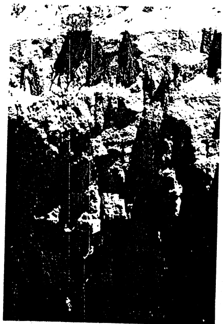
Oliete 1991. Epreuve de vitesse. 2 compétiteurs en train de remonter le P100.